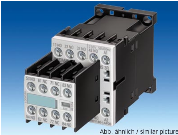
Abb. ähnlich / similar picture

HILFSSCHUETZ, 4S, DC 24V, SCHRAUBANSCHLUSS, BGR. S00