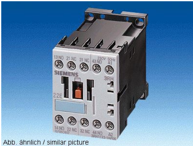
Abb. ähnlich / similar picture

KOPPELSCHUETZ, 2S+2OE, DC 24V, OHNE BED., SCHRAUBANSCHLUSS, BGR. S00